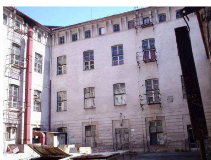
Obr.č.6 Existujúci stav - objekt č. IX