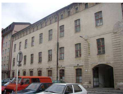
Obr.č.3 Existujúci stav - objekt č. VIII