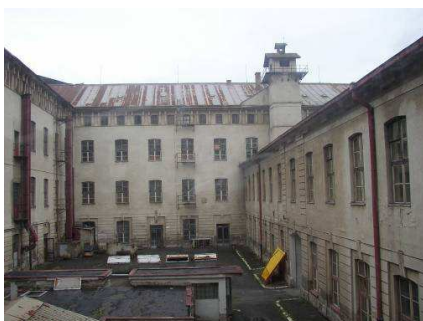
Obr.č.5 Existujúci stav - objekt č. VII