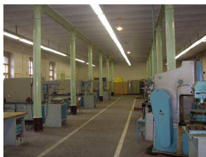
Obr.č.4 Existujúci stav interiéru - objekt č. VIII